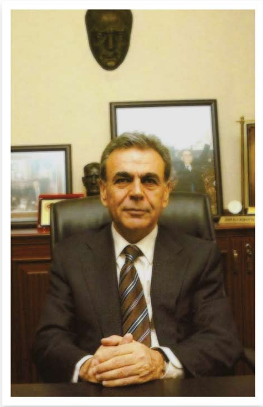
Aziz KOCAOĞLU İzmir Büyükşehir Belediyesi Başkanı