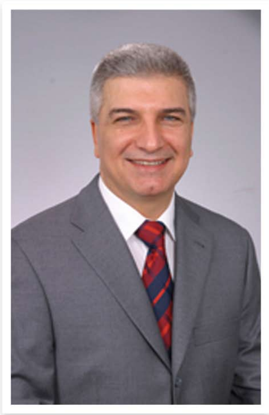
Cevat DURAK İzmir Karşıyaka Belediye Başkanı